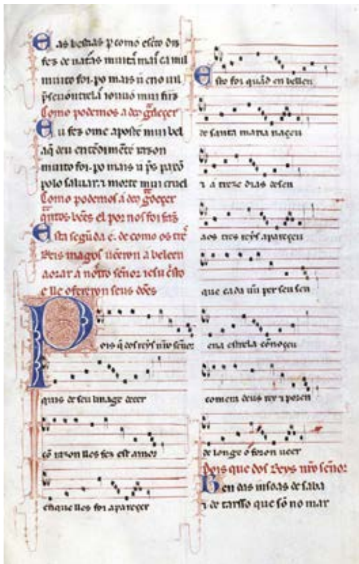
Beispielseite aus Codex Toledo, Madrid

Die Notation der CSM ist problematisch: die Tonhöhen sind auf Fünfliniensystemen klar ausgewiesen, doch die rhythmische Bedeutung der Zeichen ist umstritten. Alle Handschriften stammen aus der zweiten Hälfte des 13. Jahrhunderts, also aus der gleichen Zeit, in der Franco von Köln im Traktat „Ars cantus mensurabilis“ die mensurale Bedeutung der Notenzeichen etablierte. Die CSM verwenden die gleichen Zeichen (Longa, Brevis, Ligaturen cum opposita proprietate, Plica,...), doch zum Teil wohl in abweichender Bedeutung. Da keine zusätzlichen Stimmen oder Begleitungen ergänzende Hinweise geben, unterscheiden sich Transkriptionen in vielen rhythmischen Details und bieten Stoff für lange Diskussionen. Aufführungen der CSM, die für spezialisierte Ensembles der Frühen Musik zum gängigen Repertoire gehören, erfordern entsprechende Entscheidungen.