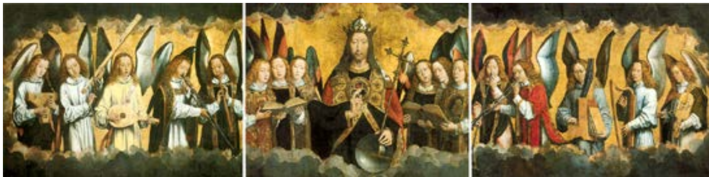
oder herrlech? (Engelskonzert vum Hans Memling 1489)