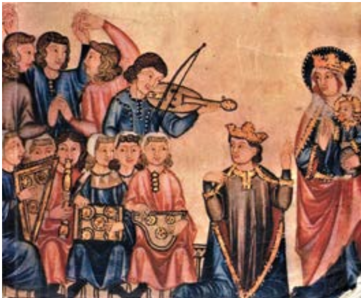
Der König als Mittler zwischen Spielern, Tänzern und der Gottesmutter, Codex Rico

„Cantigas“ sind einstimmige, mittelalterliche Gesänge in galizischer Sprache. Diese iberoromanische Sprache, die dem Portugiesischen nahesteht, galt im 13. Jahrhundert als besser geeignet für poetische Feinheiten als das noch wenig geachtete Kastilische, wozu wohl auch das Prestige der Wallfahrt nach Santiago de Compostela beitrug. Etwa 2000 weltliche und geistliche Cantiga-Texte sind überliefert, doch nur bei wenigen ist auch die Musik erhalten.