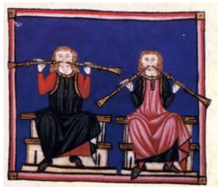
Ein Paar von Spielleuten mit je zwei schalmeiarartigen Instrumenten, Codex E

Die CSM sind in vier Prachthandschriften aus den 1270er/80er Jahren überliefert; zwei werden im Escorial aufbewahrt, eine in Madrid, eine in Florenz. Der Liedbestand