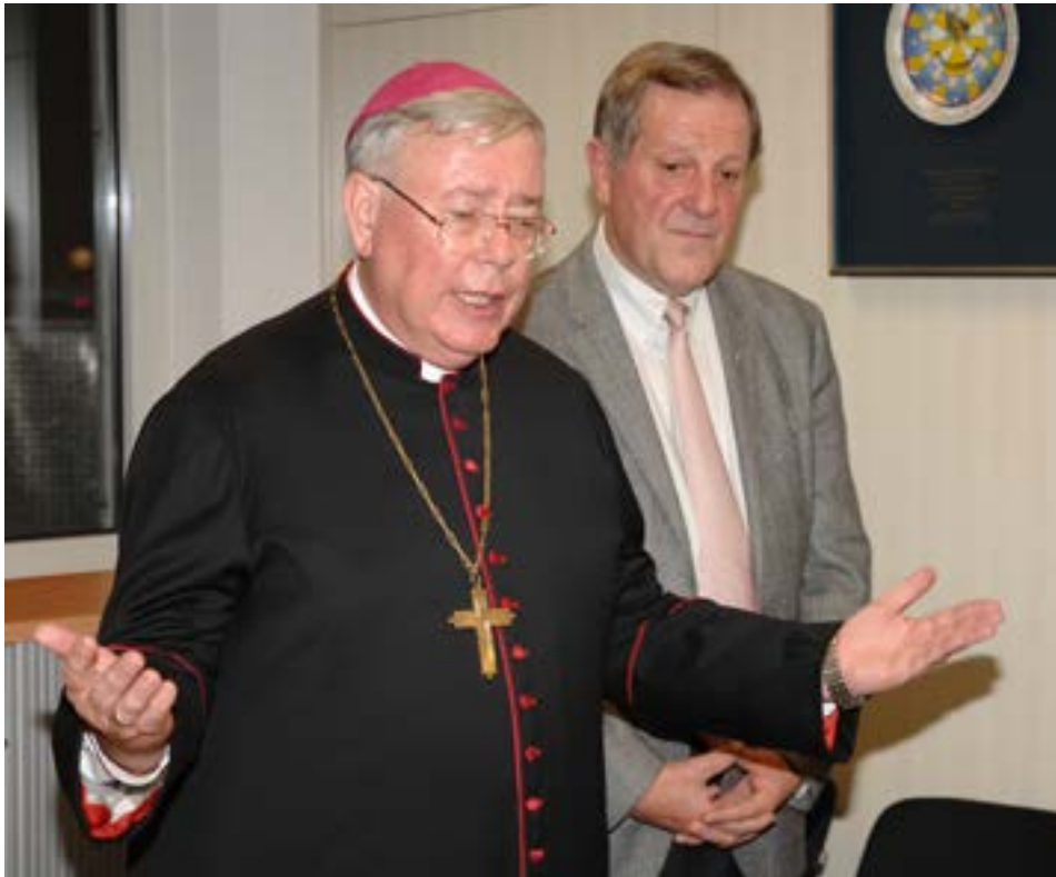
Sécher en Héichpunkt vun der Präsidenschaft: Aweigung vun den neie Verbandsbüroen 2016

Gesank a fir eise Verband geschloen. Et war him keng Stonn ze fréi oder ze spéit beim Schreiwe vun deene ville Leitartikele fir de Canticum Novum. An net ze vergiessen, säin onermiddlechen Asaz an déi vill Stonne vu Recherchë fir eist Buch, dat am Fréijoer erauskomm ass bei Geleeënheet vum Anniversaire „50 Joer Piusverband“. Hei droe vill Artikele seng Handschrëft.