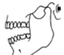
Mâchoire grande ouverte