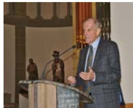
Bei de Jubiläumsfeieren am Joer 2019

D'Entente des Sociétés Gemeng Biekerech hat an hie hire Doudesannonce geschriwwen, datt hire President e Virbild war a sengem Engagement fir d'Veräinsliewen. Jo, dat war hien: e Virbild fir äis all! Nieft senger aldeeglecher Aarbecht huet hie vill Zäit investéiert, fir datt et am Veräinsliewen iwwerall sollt weidergoen.