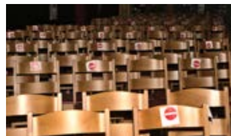
Wéi sangen eis Choralle muer? Virun eidele Still?"

Mee wéi dunn déi éischt zaghaft Öffnung koumen, an op ville Plazen ons Paschtéier hu missten Decisiounen huelen, wéi eng Kierch da wou genuch Kapazität huet, fir déi gefuerdert Distanzen ze garantéieren, war alt erëm de Kaméidi grouss, wéi mer op Plaze gesot