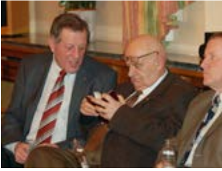
Gespréich mat de Kollege vun der UGDA beim Neijooschpatt

Mënsch war, ouni no bausse groussen Opwand ze maachen.